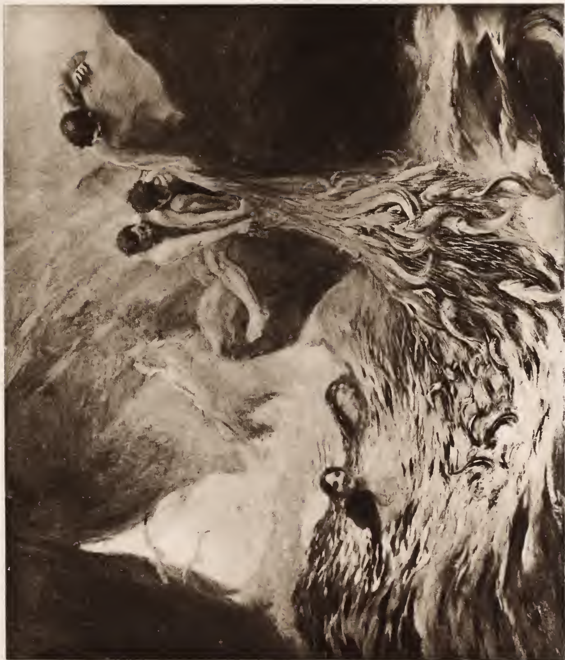
Procede et des ouvrages Petit